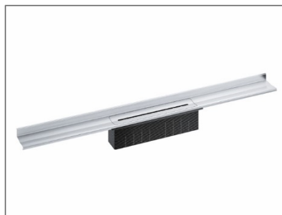
HL-GF Christoph Schütz; Duschrinne WALL Standard